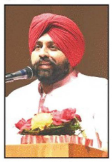
ਪੰਜਾਬ ਸਰਕਾਰ ਪੰਜਾਬੀ ਭਾਸ਼ਾ ਦੇ ਮਹੱਤਵ ਨੂੰ ਦਰਸਾਉਂਦੇ ਹੋਏ ਪੰਜਾਬੀ ਵਿਸ਼ੇ ਨੂੰ ਲਾਜ਼ਮੀ ਵਿਸ਼ੇ ਵਜੋਂ ਨੋਟਿਸ ਜਾਰੀ ਕੀਤਾ ਹੈ।

ਚੰਡੀਗੜ੍ਹ/10 ਫਰਵਰੀ: ਪੰਜਾਬ ਦੇ ਸਕੂਲ ਸਿੱਖਿਆ ਵਿਭਾਗ ਵੱਲੋਂ ਜਲੰਧਰ ਦੇ ਕੋਈ ਸਕੂਲ ਨੂੰ ਪੰਜਾਬੀ ਵਿਸ਼ੇ ਨੂੰ ਲਾਜ਼ਮੀ ਵਿਸ਼ੇ ਵਜੋਂ ਨੋਟਿਸ ਜਾਰੀ ਕੀਤਾ ਹੈ। ਇਸ ਸਬੰਧੀ ਸਾਰੇ ਵਿਦਿਆਰਥੀ ਪੰਜਾਬ ਦੇ ਸਕੂਲ ਸਿੱਖਿਆ ਮੰਤਰੀ ਨੇ ਸਕੂਲ ਸਿੱਖਿਆ ਵਿਭਾਗ ਨੂੰ ਲਿਖਿਆ ਕਿ ਪੰਜਾਬੀ ਵਿਸ਼ੇ ਨੂੰ ਲਾਜ਼ਮੀ ਵਿਸ਼ੇ ਵਜੋਂ ਨੋਟਿਸ ਜਾਰੀ ਕੀਤਾ ਹੈ। ਇਸ ਸਬੰਧੀ ਸਾਰੇ ਵਿਦਿਆਰਥੀ ਪੰਜਾਬ ਦੇ ਸਕੂਲ ਸਿੱਖਿਆ ਮੰਤਰੀ ਨੇ ਸਕੂਲ ਸਿੱਖਿਆ ਵਿਭਾਗ ਨੂੰ ਲਿਖਿਆ ਕਿ ਪੰਜਾਬੀ ਵਿਸ਼ੇ ਨੂੰ ਲਾਜ਼ਮੀ ਵਿਸ਼ੇ ਵਜੋਂ ਨੋਟਿਸ ਜਾਰੀ ਕੀਤਾ ਹੈ।